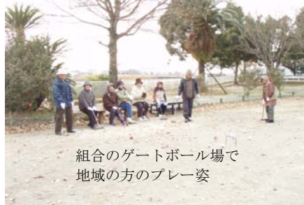
組合のゲートボール場で地域の方のプレー姿