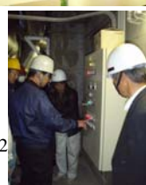
組合長が炉に点火

香南清掃組合では、毎年恒例の行事として、年頭の仕事始めに併せて組合長はじめ職員一同並びに地域の方々(南三島・北三島・比江・古市・廿枝)の代表者と一緒この1年間事故のないよう、また安全に運転稼働ができますよう火入れ式を行っております。