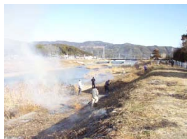
岡豊、長岡、国府地区の皆さん総出で毎年2月の恒例行事として国分川の堤防の芝焼きをし、国分川をきれいにしています。