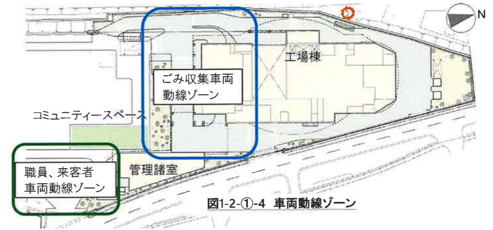
図1-2-①-4 車両動線ゾーン